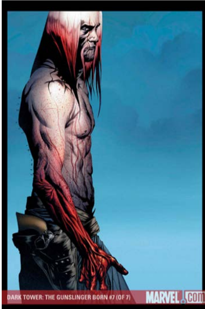
THE DARK TOWER THE GUNSLINGER BORN #7 MARVEL

La primera saga en cómics que adapta historias de La Torre Oscura llegará a su final cuando se publique su número 7, del que adelantamos su ilustración de portada (obra de Jae Lee y Richard Isanove), como venimos haciendo los últimos meses. ■