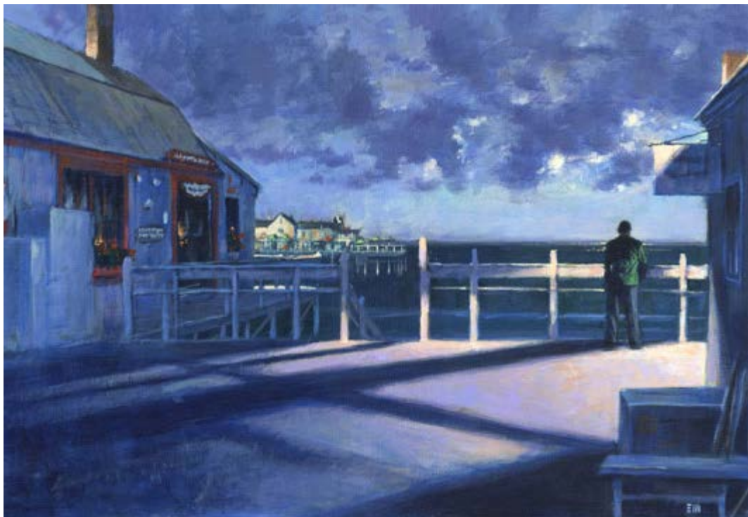
Ilustración de Les Edwards para "The Colorado Kid"

Ha ganado seis veces el British Fantasy Award por Mejor Artista y ha sido nominado tres veces para un World Fantasy Award . En los últimos años, ha trabajado también con el seudónimo de Edward Miller, realizando un estilo de dibujo distinto, más romántico.