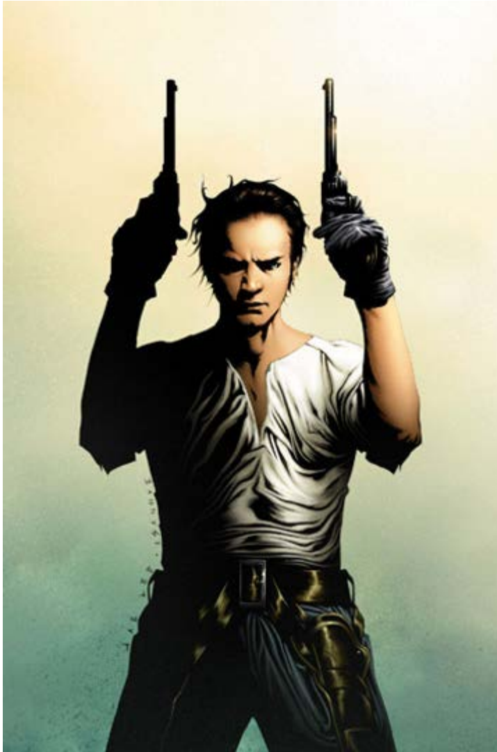
THE DARK TOWER THE GUNSLINGER BORN #3 MARVEL

Sin lugar a dudas, uno de los hitos del año en el universo de Stephen King son los cómics de La Torre Oscura . En la imagen podemos apreciar la portada del Nº 3 de The Gunslinger Born , la saga que se está editando este año. ■