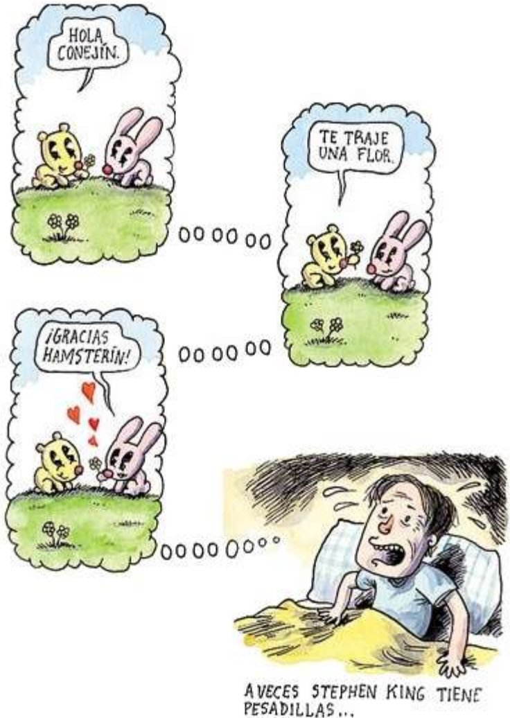
CHISTE POR LINIERS DIARIO "LA NACIÓN"

Cada tanto, traemos a esta sección algún chiste gráfico que hace referencia a Stephen King. El de este mes fue publicado en agosto en el diario argentino La Nación , en la sección del chiste de Liniers; y nos pareció que valía la pena compartirlo con todos los lectores. ■