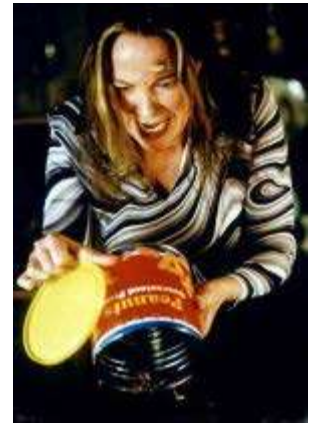
Película: The Revelation of Becka Paulson (episodio de la serie The Outer Limits )

Como dato curioso, cabe mencionar que en la miniserie televisiva The Tommyknockers también se cuenta esta historia, aunque con ligeras variantes. En la miniserie, los personajes de Becka y Joe Paulson fueron interpretados por Allyce Beasley y Cliff DeYoung.