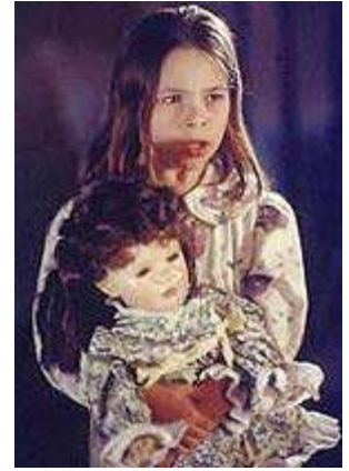
Película: Chinga (episodio de la serie The X Files )

La palabra Chinga es el nombre de un meteorito que cayó en Siberia en 1913 y también es, supuestamente, el nombre de la muñeca de la niña. Pero debido a su significado en español (por todos conocido), los ejecutivos de la cadena Fox decidieron a último momento cambiar el título para la distribución mundial del episodio.■