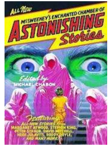
Libro: McSweeney's Enchanted Chamber of Astonishing Stories Editado por: Michael Chabon Año de publicación: 2005