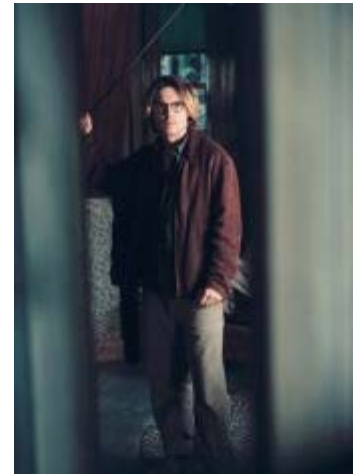
Película: Secret Window Duración: 106' Dirección: David Koepp Guión: David Koepp Actores: Johnny Depp, John Turturro, Maria Bello Estreno: 2004 Basada en la novela Secret Window, Secret Garden (Ventana Secreta, Jardín Secreto) , de Stephen King

Todo esto podría dar forma a un thriller clásico sobre cosas que van mal de noche, pero Johnny