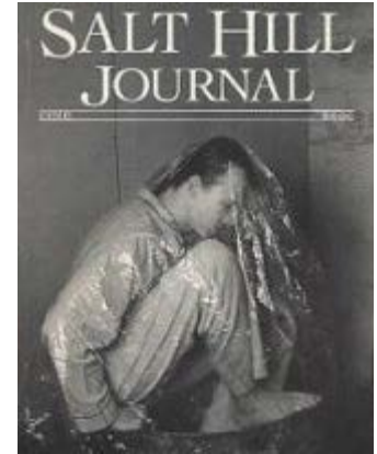
Portada del "Salt Hill Journal" que contiene el poema Dino , de King

Se sabe que King firmó 5 ejemplares de esta revista, y que son hoy muy buscados por los fans, coleccionistas y completistas de su obra literaria.