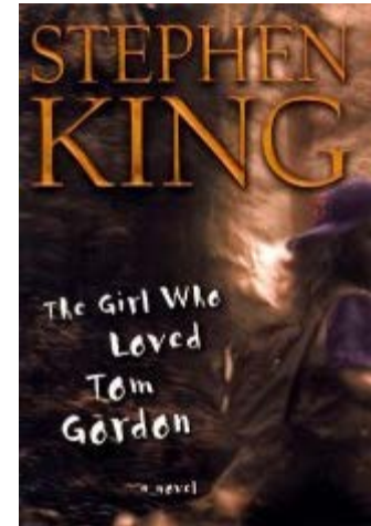
La novela de King que podría convertirse en un libro para niños

"Estoy encantado de poder ampliar el rango de mis lectores, mientras continúo publicando de maneras nuevas y diferentes. The Girl Who Loved Tom Gordon es una puesta al día de Hansel y Gretel, un libro que los niños aman. Y trataré de no asustarlos... bueno, no mucho."