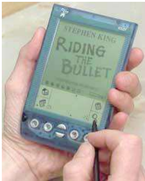
STEPHEN KING RIDING THE BULLET

Parece que era mentira el hecho de que el libro electrónico Riding The Bullet no se podía llevar a cualquier lado, como un libro común. La versión para computadoras palmtop (tal como la que vemos en la fotografía), lo desmiente; ya que un "juguete" como estos puede transportarse fácilmente. Eso sí: no todos poseemos uno, y los mismos no son nada baratos, todavía.