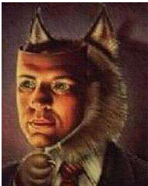
LA TIENDA DE LOS DESEOS MALIGNOS

2- NOTA DEL EDITOR - Lo importante es el cuento