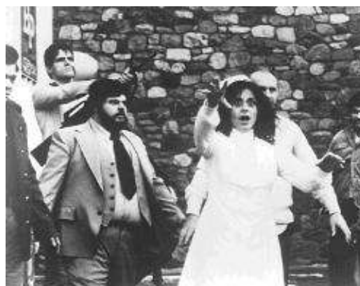
Dawn of the Dead (1978)

Hay un montón de defectos en la película. Ninguno de los papeles principales de indio está interpretado por indios auténticos. La ciencia, cuando no aparece equivocadamente, esta usada de manera oportunista teniendo en cuenta el propósito de los realizadores de crear una película de "conciencia social".