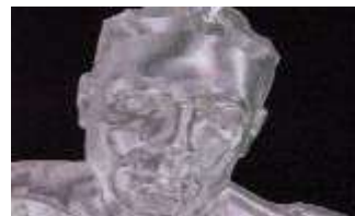
THE LAWNMOWER MAN

Este título, editado por Sales Curbe Interactive , es más reciente (año 1994), y está basado en la película del mismo nombre que, todos sabemos, poco y nada tiene que ver con el cuento original de King. El juego es un arcade del estilo Dragon's Lair (aprieta la tecla en el momento justo, sino pierdes una vida) con algo de ingenio. Consiste en resolver en forma correlativa una serie de enigmas. El aspecto gráfico está muy cuidado, con escenas tomadas directamente de la película. No es un mal título, pero tampoco es de lo más recordado que diera la industria del videojuego en los últimos años. Mucha realidad virtual, poco terror y casi nada de King.