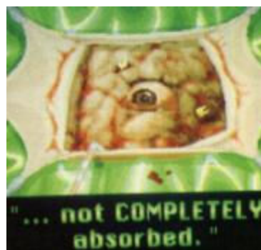
Presentación de THE DARK HALF

"The Dark Half" (La Mitad Siniestra): Una buena idea, pero mal terminada. Esta aventura gráfica para PC, de la empresa Capstone, nos pone en la piel de Thad Beaumont, con el fin de deshacernos de nuestra contraparte George Stark. El juego empieza con una buena presentación, donde vemos a varios médicos practicando la operación que se describe en el comienzo del libro, en la cual se extirpan los restos del hermano gemelo del cerebro de Thad. También vemos la primera llegada de los gorriones. Luego entramos en el juego propiamente dicho, donde mediante íconos gráficos indicamos las acciones a realizar por Beaumont. Podemos revisar la casa, ir al cementerio, al pueblo, etc.; mientras los crímenes se van sucediendo. Los gráficos no son buenos, tampoco el sonido ni los movimientos ayudan mucho. El juego está enteramente basado en el guión de George Romero para la película que, cabe decirlo, respeta bastante el libro original de King. En definitiva, un