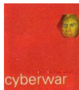
Estuche de presentación de CYBERWAR

"Cyberwar": si el juego anterior tenía muy poco de King, en este ya no queda nada. En teoría, es la segunda parte de The Lawnmower Man , aunque explícitamente no lo dice en ninguna parte del juego. Similar al anterior en el aspecto técnico, presenta alguna leve mejoría en la jugabilidad. Se presenta en tres CD, lo que habla a las claras de su voluminosidad. El aspecto gráfico es lo más logrado y destacable, con gran cantidad de animaciones continuas. Un párrafo aparte merece la música y el sonido, perfectamente logrados. Junto con el software, se incluye un CD de edición limitada de Steve Hillage, el creador de la banda sonora del juego. Un gran producto, pero a años luz de tener la atmósfera de una historia de Stephen King.