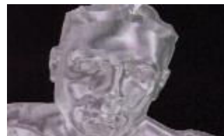
THE LAWNMOWER MAN

Este título, editado por Sales Curbe Interactive , es más reciente (año 1994), y está basado en la película del mismo nombre que, todos sabemos, poco y nada tiene que ver con el cuento original de King. El juego es un arcade del estilo Dragon's Lair (aprieta la tecla en el momento justo, sino pierdes una vida) con algo de ingenio. Consiste en resolver en forma correlativa una serie de enigmas. El aspecto gráfico está muy cuidado, con escenas tomadas directamente de la película. No es un mal título, pero tampoco es de lo más recordado que diera la industria del videojuego en los últimos años. Mucha realidad virtual, poco terror y casi nada de King.