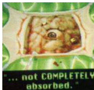
Presentación de THE DARK HALF

"The Dark Half" (La Mitad Siniestra): Una buena idea, pero mal terminada. Esta aventura gráfica para PC, de la empresa Capstone, nos pone en la piel de Thad Beaumont, con el fin de deshacernos de nuestra contraparte George Stark. El juego empieza con una buena presentación, donde vemos a varios médicos practicando la operación que se describe en el comienzo del libro, en la cual se extirpan los restos del hermano gemelo del cerebro de Thad. También vemos la primera llegada de los gorriones. Luego entramos en el juego propiamente dicho, donde mediante íconos gráficos indicamos las acciones a realizar por Beaumont. Podemos revisar la casa, ir al cementerio, al pueblo, etc.; mientras los crímenes se van sucediendo. Los gráficos no son buenos, tampoco el sonido ni los movimientos ayudan mucho. El juego está enteramente basado en el guión de George Romero para la película que, cabe decirlo, respeta bastante el libro original de King. En definitiva, un