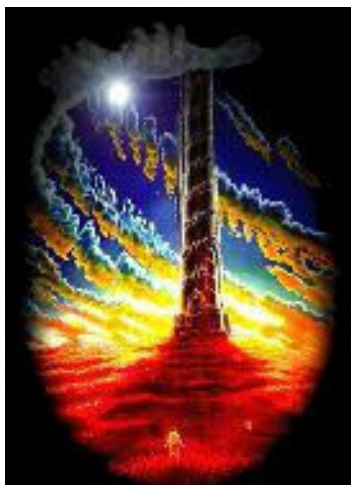
LA TORRE OSCURA 3